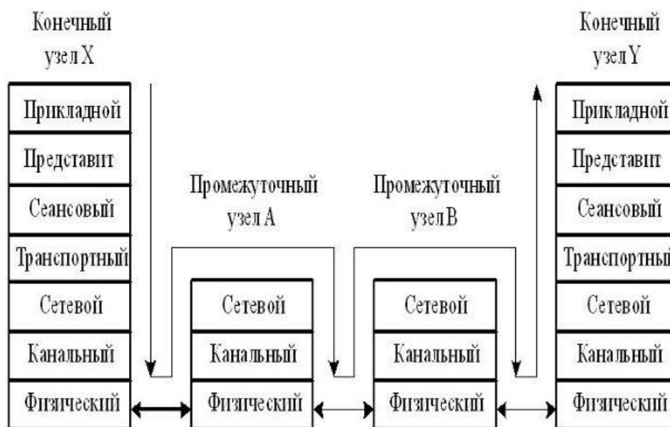
Рис. 1.9. Передача сообщения по сети

на промежуточных устройствах сообщение обрабатывается средствами только трех или даже двух нижних уровней (рис. 1.9).