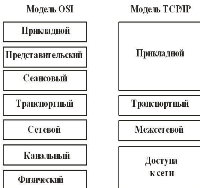
Рис. 1.8. Модели OSI и TCP/IP

Помимо семиуровневой OSI модели на практике применяется четырехуровневая модель TCP/IP (рис. 1.8).