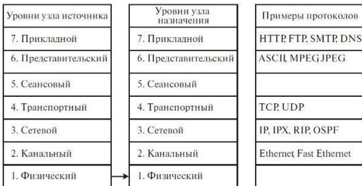
Рис. 1.5. Семиуровневая модель ISO/OSI

Модель ISO/OSI включает семь уровней. На рис. 1.5 показана модель взаимодействия двух устройств: узла источника (source) и узла назначения (destination). Совокупность правил, по которым происходит обмен данными между программно-аппаратными средствами, находящимися на одном уровне, называется протоколом . Набор протоколов называется стеком протоколов и задается определенным стандартом. Взаимодействие между уровнями определяется стандартными интерфейсами .